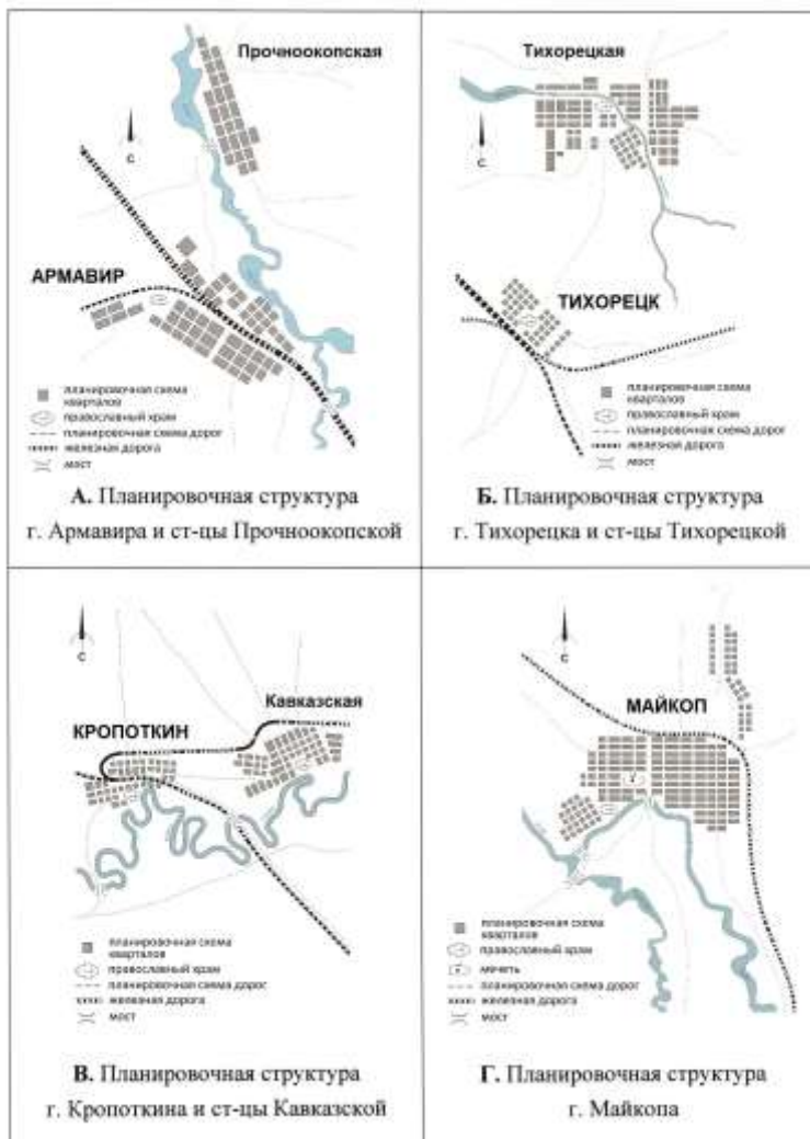
Рисунок 2 – Влияние железной дороги на формирование и развитие планировочной структуры поселений. Первая половина XX в.

коридоре. Одновременно данные пути сообщения, связывающие между собой различные населенные пункты, формировали планировочно-коммуникационные оси по всей территории региона (рисунок 2).