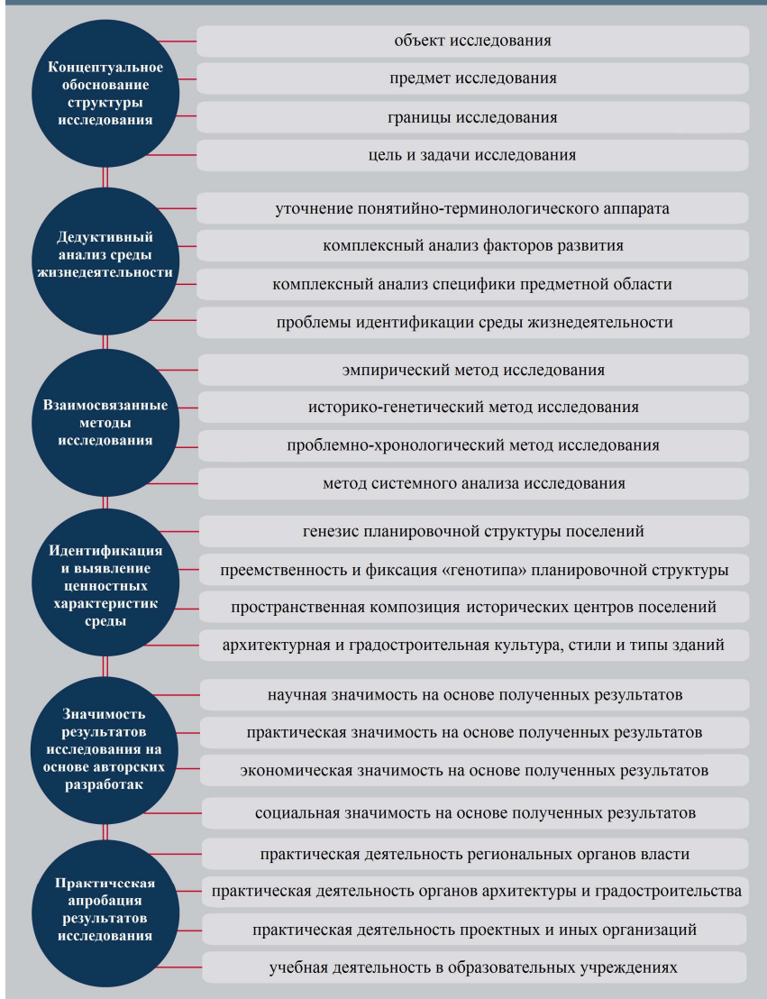
Рисунок 1 – Логико-структурная модель исследования