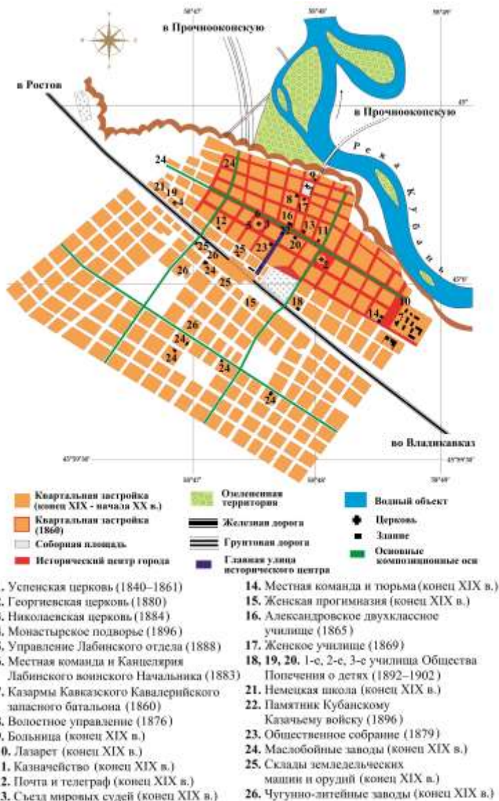
Рисунок 3 – Планировочная структура г. Армавира. Конец XIX – начало XX в.