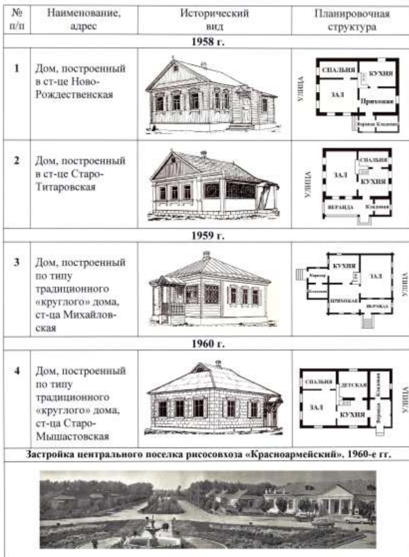
Таблица 1 – Жилые дома, построенные на Кубани. Вторая половина XX в. Застройка центрального поселка рисовхоза «Красноармейский». 1960-е гг.