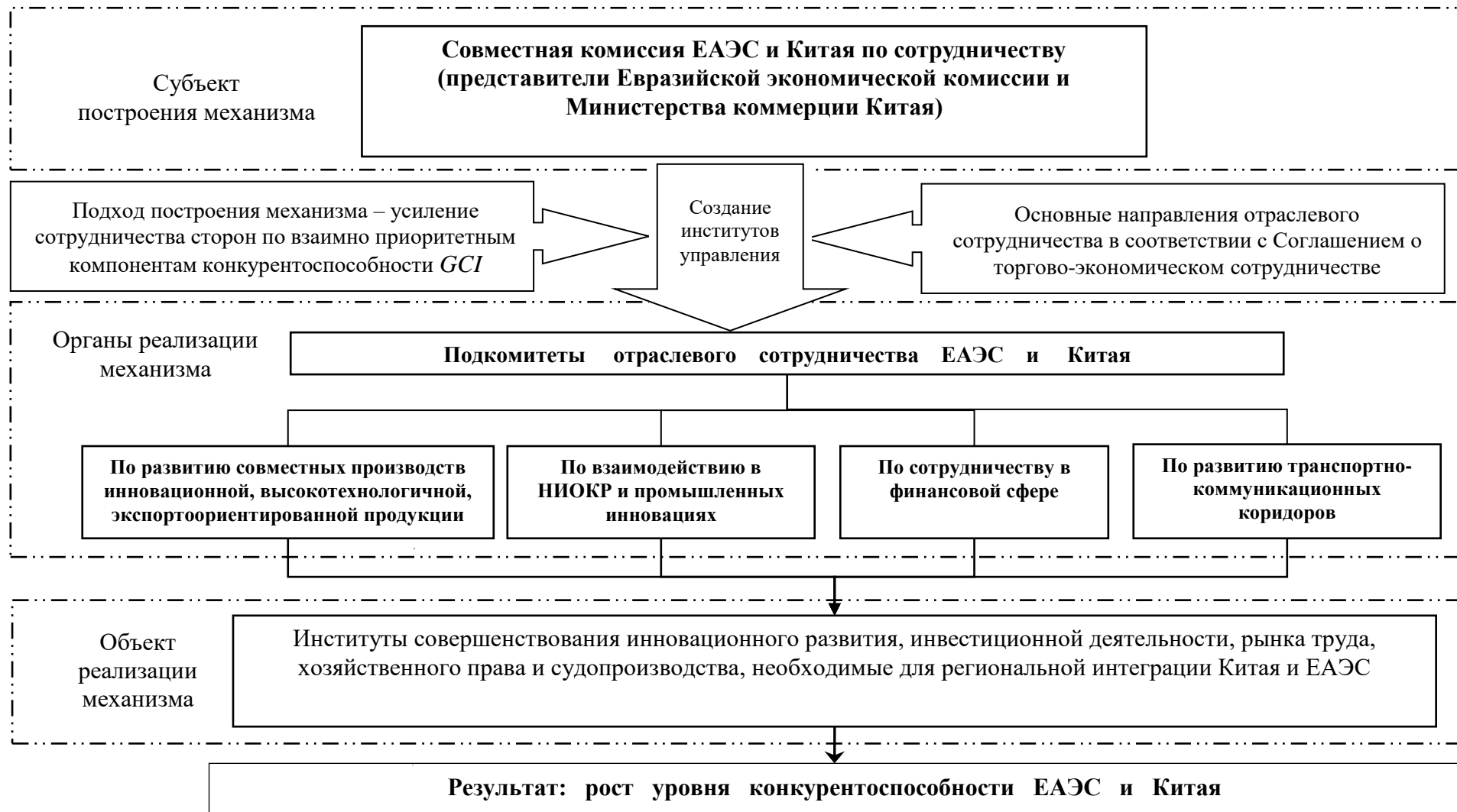
Рисунок 2. – Модель построения организационно-экономического механизма сопряжения ЕАЭС и инициативы «Пояс и путь»