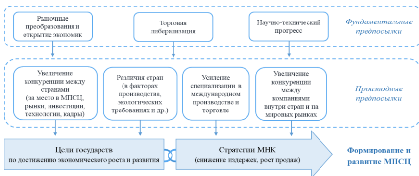
Рисунок 1 – Основные предпосылки, оказывающие влияние на формирование и развитие МПСЦ

транспортных и коммуникационных издержек, либерализация торговли, научно-технический прогресс, выход на мировой рынок большого числа новых игроков (рисунок 1).